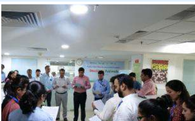
PMBI Head office, New Delhi

All PMBI employees/other enthusiastically participated in these 15 days campaign with an objective to spread awareness about maintaining cleanliness around the surroundings.