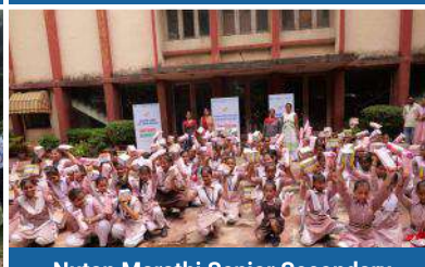
Nutan Marathi Senior Secondary School, Pahar Ganj, New Delhi