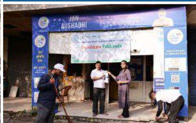
PMBJK, Dilshad Garden, New Delhi