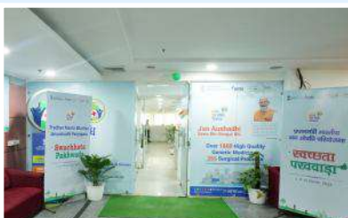
PMBI Head office, New Delhi