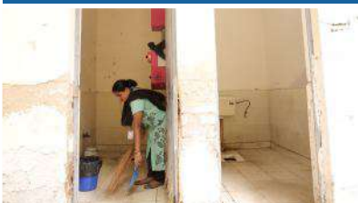
Nutan Marathi Senior Secondary School, Pahar Ganj, New Delhi