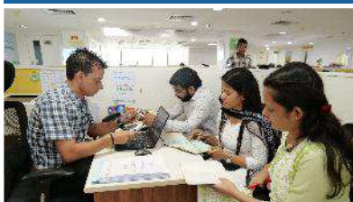
PMBI Head office, New Delhi