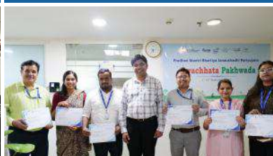
PMBI Head office, New Delhi