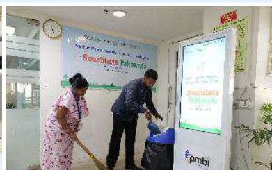
PMBI Head office, New Delhi