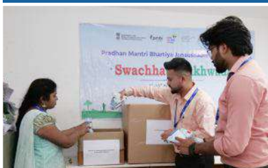
PMBI Head office, New Delhi