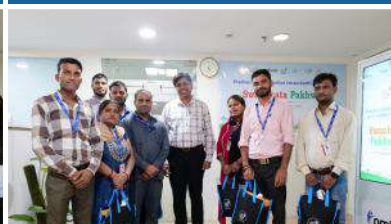
PMBI Head office, New Delhi