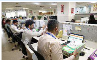
PMBI Head office, New Delhi