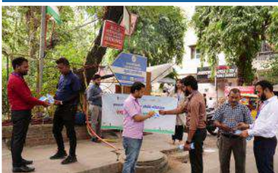
Cycle Market, Jhandewalan, New Delhi