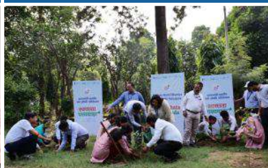
Park, Jhandewalan, New Delhi