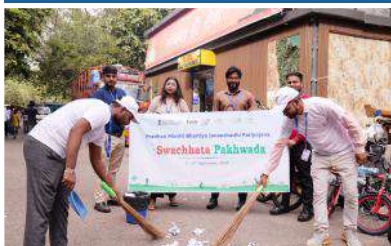
Cycle Market, Jhandewalan, New Delhi