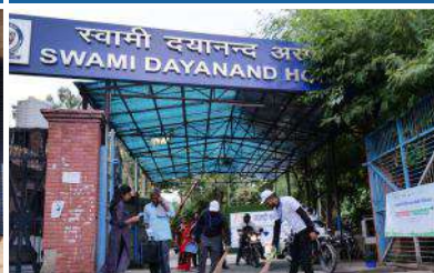
Swami Dayanand Hospital, Dilshad Garden, New Delhi